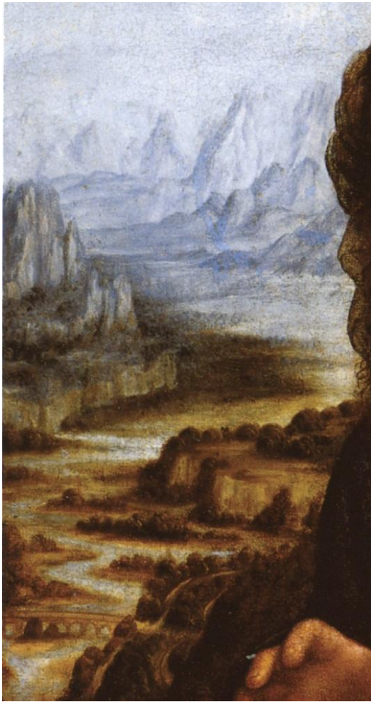
Particolare del dipinto