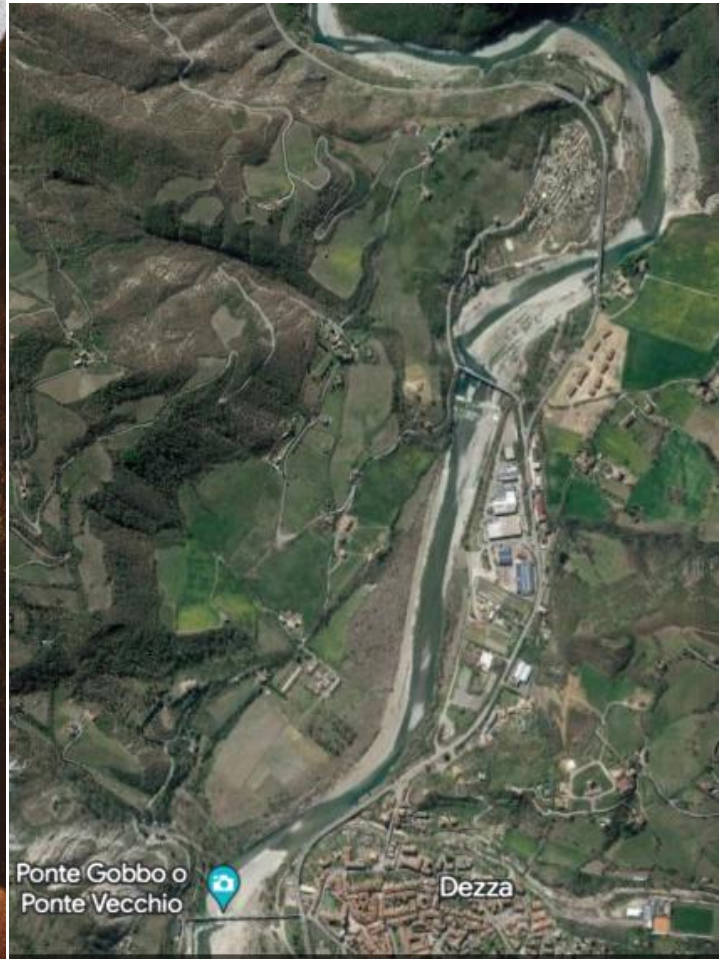
Ripresa di Google earth

Il corso del fiume Trebbia su google earth ha andamento verificabilmente del tutto simile al corso del fiume dipinto nella Madonna dei fusi . La sovrapposibilità delle immagini non può essere data, non solo perché trattasi di opera d'arte ma anche per lo scarto implicato dalla ripresa aerea sia per la rilevante altezza che per l'angolazione. Tuttavia possiamo verificare che :